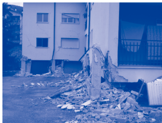
Aquila – Pettino : bâtiment en béton armé avec transparence

Le lundi 20 avril, à la demande de la protection civile italienne, l'AFPS a organisé une conférence regroupant plus de 60 experts internationaux en mission sur Aquila, afin d'échanger et mettre en place la collaboration future pour l'étude de ce séisme et de ses conséquences.