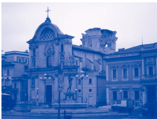
Aquila – place Duomo