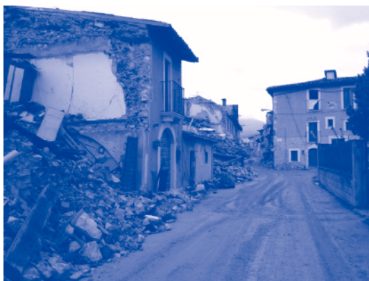
Onna : destruction de plus de 80% du village

Les informations ont été récupérées, soit par des observations visuelles, par des interviews et/ou par la récupération de documents divers (cartes, rapports, données sismiques). Cela ne faisant pas partie de l'objectif, aucune instrumentation ou récupération d'échantillons n'a été effectuée dans le cadre de cette mission.